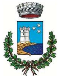
Comune di Valderice