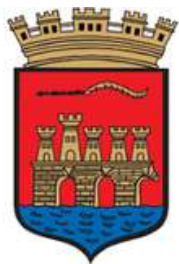
Comune di Trapani