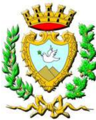
Comune di Erice Città di Pace e per la Scienza