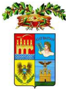
Libero Consorzio Comunale di Trapani